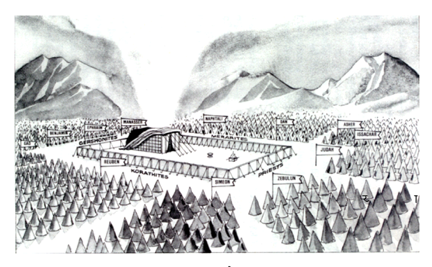
उजाङ्स्थानमा भएको निवासस्थान

निवासस्थानका सबै सामग्रीहरूले स्वर्गको महिमामा प्रवेश गर्नुभएको ख्रीष्ट येशूको कुरा गर्छन्; अनि सन्दुकचाहिँ उहाँको परमेश्वरत्व र उहाँको मानवताको प्रतीक हो। किनभने यसको सुनले उहाँको परमेश्वरत्व, र यसको काठले उहाँको मानवताको चित्रण गर्छ। कृपा-आसनले ख्रीष्ट येश्लाई प्रायश्चित्तको रूपमा प्रस्तुत गर्छ (रोमी ३:२५); उहाँ हाम्रो निम्ति अनुग्रहको सिंहासनमाथि बस्नुभएको छ। अनि भेटीका रोटीहरूको टेबलचाहिँ ? यस टेबलले खीष्ट येशुलाई जीवनको रोटीको रूपमा प्रस्तुत गर्छ । अनि सुनको सामदानले ख्रीष्ट येशूलाई संसारको ज्योतिको रूपमा चित्रण गर्छ। पित्तलको वेदीको तत्पार्य यस प्रकारको छः ख्रीष्ट येश् हाम्रो होमबलि हुनुहुन्छ (प्रस्थान २७); उहाँ परमेश्वरको निम्ति सर्वाङ्ग होमबलि हुनुभयो। यस धूपको वेदी, यस सुनको वेदीले खीष्ट येशू परमेश्वरको निम्ति कति मीठो वासना हुनुहुन्छ, सो कुरा प्रस्तुत गर्छ (प्रस्थान ३०)। अनि हातखुट्टाहरू धुने बाटाले ख्रीष्ट येशूलाई कुन रूप दिएर प्रस्तुत